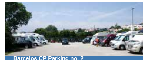
Barcelos CP Parking no. 2