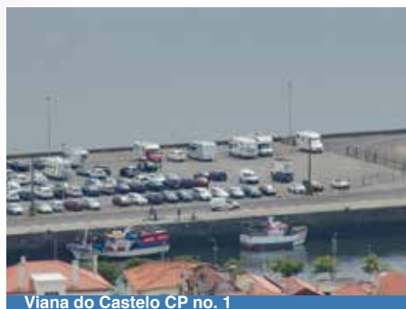
Viana do Castelo CP no. 1

Parkeerterrein bij de rivier. Je wandelt in 5 minuutjes naar de stad en de donderdagmarkt. Voor de markt moet je woensdag vroeg een plek zoeken. Op donderdagochtend is het verkeer richting het stadje een gekkenhuis. Wij kwamen volledig vast te zitten in de files. We vonden een plekje omdat er net iemand wegging.