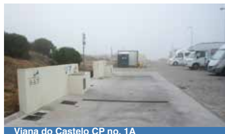
Viana do Castelo CP no. 1A