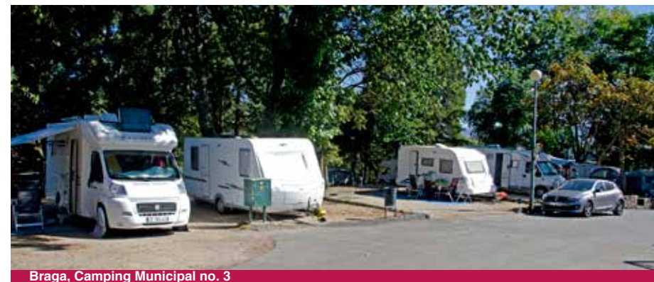
Braga, Camping Municipal no. 3

Gemeentecamping aan de rand van de stad, in heuvelachtig terrein. Meeste plekken zijn alleen geschikt voor tenten. Langs een rand (redelijk steil weggetje) zijn wat mooie plekken maar die zijn zeker niet geschikt voor campers langer dan ca. 6 meter. Bovenaan het terrein zijn plekken voor ca. 7 à 10 campers ingericht direct bij de weg (achter een muur) en daar is aardig wat verkeer. Desondanks wel een fijne camping om de stad en Bom Jesus te bezoeken (naar het centrum met de bus max 10 minuten, dan Bom Jesus, bus 2, maximaal 20 minuten). Lopen naar het centrum kan ook, je wandelt in ca. 20 minuten naar beneden/centrum. Sanitair is matig, douche-ruimtes krap, wel lekker warm water. Je mag gebruik maken van het zwembad dat onderaan de camping ligt. Honden toegestaan. Niet geschikt voor gehandicapten.