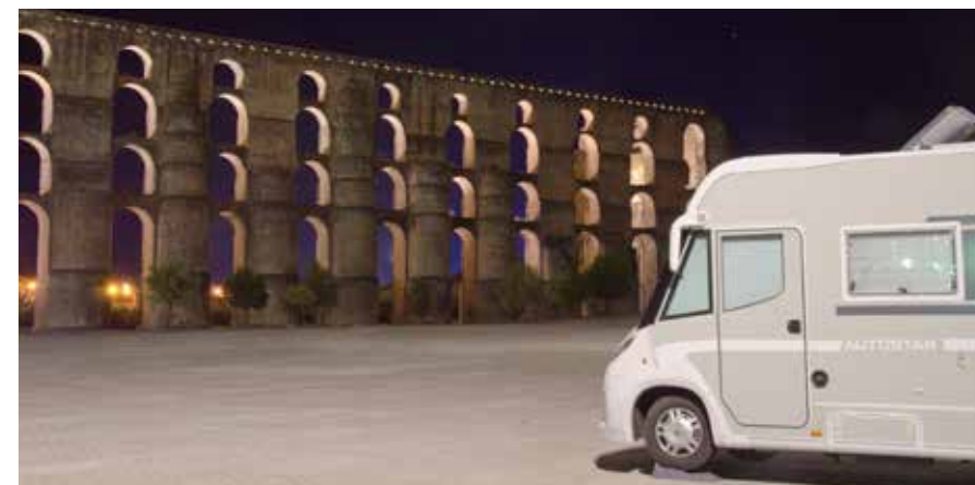
Camperplaats bij Elvas met uitzicht op het aquaduct

Vanuit Pomarinho nemen we de N246 naar Elvas, dicht bij de grens met Spanje, waar we een prachtige camperplaats vinden. We staan hier op een groot parkeerterrein aan de rand van een heuvel die beplant is met