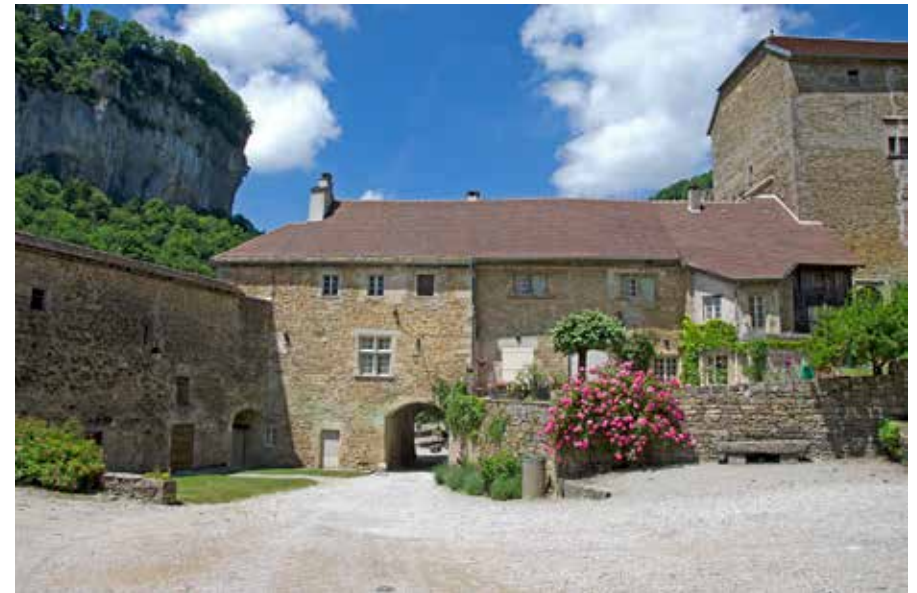
Het Benediktijnse klooster van Baume-les-Messieurs in het grootse decor van kalkstenen rotswanden

Op weg naar een van de mooiste locaties in de Jura, Baume-les-Messieurs, komen we langs Poligny (N83, N5) en Château-Chalon (D68, D96 en D5). Poligny is de hoofdstad van de Comté kaas en Château-Chalon is bekend vanwege de 'Vin Jaune'. We nemen deze route omdat we via de D5 dwars door het wijndorp komen. Hoewel de weg soms akelig smal wordt, genieten we van de panorama's over de wijngaarden vanuit Château-Chalon en op de slingerweg naar Voiteur. We rijden dit stuk in het late voorjaar, maar hier moet je eigenlijk eind september zijn, als de druivenbladeren geel en dieprood kleuren. Het op een heuvel gelegen dorp met zijn fraaie abdijkerk is een van de meest fotogenieke in de Jura.